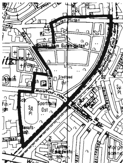
Übersichtsplan Nr. 3 M. 1 : 15.000 Abgrenzung des Bebauungsplanes Nr. 299

Herausgegeben vom Oberstadtdirektor der Stadt Münster — Presse- u. Informationsamt —, Stadthaus, Klemensstraße, Ruf 492-1350. Redaktion: Ernst-Ulrich Sypiena Einzelpreis: 0,80 DM Bezugsgeld jährlich 23 DM. Abonnementsbestellungen sind zu richten an den Oberstadtdirektor der Stadt Münster — Presse- u. Informationsamt —, Kündigung spätestens bis zum 15. Dezember für den 1. Januar des folgenden Jahres. Einzelnummern sind in der Bürgerberatung, Heinrich-Brüning-Straße 9, erhältlich. Druck: Joh. Burlage 48157 Münster, Kiesekampweg 2, Ruf 2 42 22