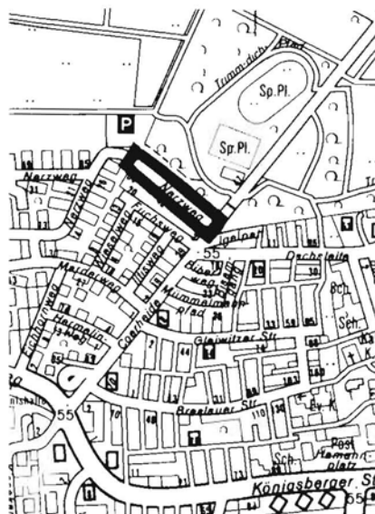
Übersichtsplan Nr. 2 M. 1 : 15000 Nerzweg von der Straße Coerheide bis zur nordwestlichen Ecke des Grundstücks Fuchsweg 20

Die öffentliche Auslegung erfolgt vom 30. 5. - 13. 6. 1988 während der Dienststunden bei der Stadtverwaltung Münster,