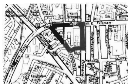
Übersichtsplan Nr. 2 M. 1 : 20000 Geltungsbereich der Veränderungssperre Nr. 42

§ 18 Abs. 1 Satz 1 sowie Abs. 2 Satz 2 und 3 BBauG: